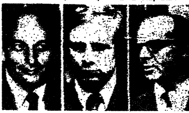
המשפטים: 19 מבין 23 המושבעים הגיעו למסקנה שיש לנקוט בפעולה כלשהי

ב.ג. טיימס: 19 מבין 23 המושבעים הגיעו למסקנה שיש לנקוט בפעולה כלשהי